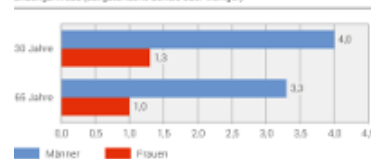
Differenz bei der Lebenserwartung zwischen Bildungsniveaus nach Alter, 2011–2014 16 Jahren zwischen dem höchsten (Tertiärstufe) und dem tiefsten Bildungsniveau (obligatorische Schule oder weniger)

Wie das Bundesamt für Statistik (BFS) in der aktuellen Erhebung aufzeigt, differiert die Lebenserwartung je nach Bildungsniveau: Ein Mann mit Tertiärabschluss hat gegenüber einem Mann mit obligatorischer Schule eine ca 3-4 Jahre höhere Lebenserwartung.